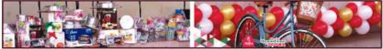
Entrega de despensas a las madres de la comunidad de Tateposco.