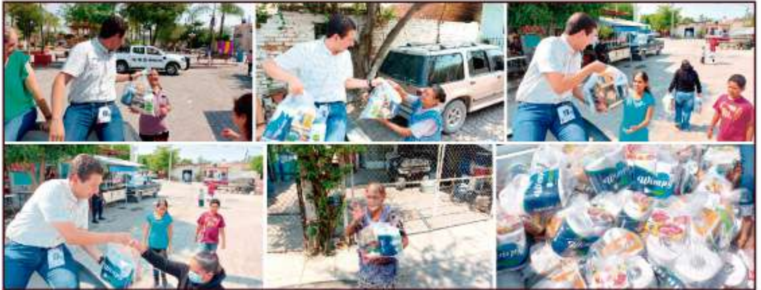
Festejo realizado para todas las madres de la localidad de Santa Teresa.